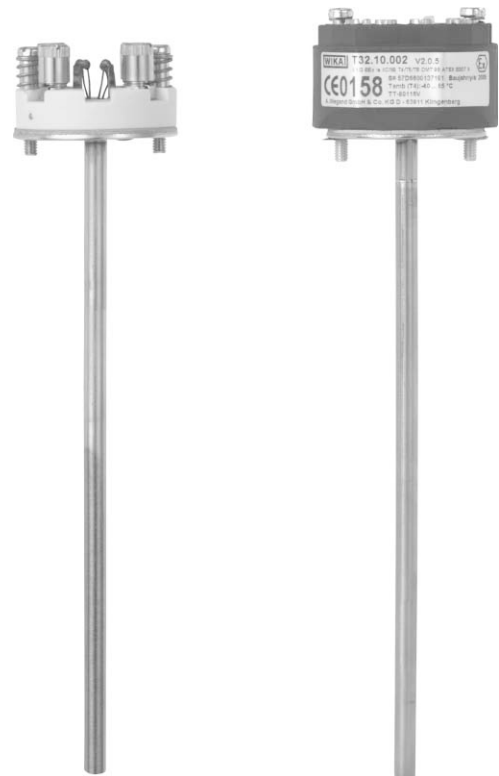
Thermoelement-Messeinsatz, flexibel Typ TC002 Abb. links mit Anschlusssockel Ø 42 mm Abb. rechts mit montiertem Transmitter

Starre Rohrausführungen sind ebenfalls lieferbar. Sensortyp, -anzahl und Genauigkeit sind für die jeweilige Anwendung individuell wählbar. Nur bei korrekter Messeinsatzlänge und -durchmesser ist ein ausreichender Wärmeübergang vom Schutzrohr auf den Messeinsatz gewährleistet. Die Wahl von Norm- oder Standardlängen